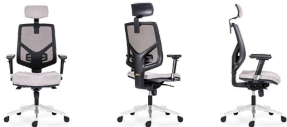
1750 SYN SKILL ALU PDH +AR 08C