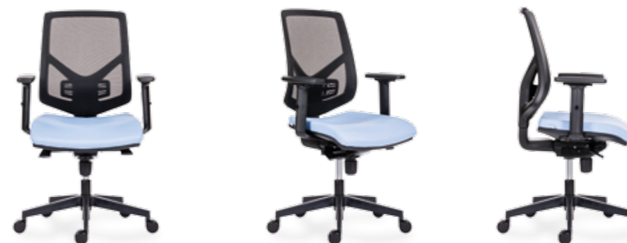
1750 SYN SKILL +BR 16