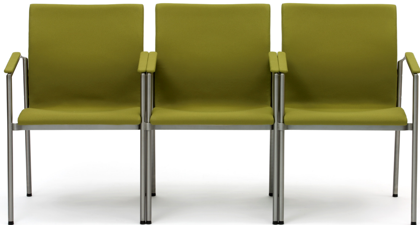
Infinity Clip Standard umožňuje snadné spojení židlí do řady. The Infinity Clip Standard allows quick joining of chairs into a row. Der Infinity Clip Standard ermöglicht eine einfache reihenweise Verknüpfung von Stühlen.