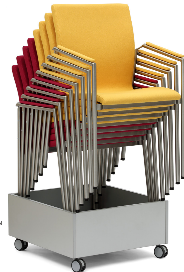
INFINITY clip, konstrukce umožňuje jednoduché stohování židlí. The INFINITY clip, the construction allows easy stacking of chairs. INFINITY Clip, die Bauart ermöglicht eine einfache Stuhlstapelung.